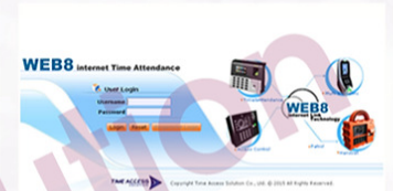
WEB 8 INTERNET LINK

จัดเก็บลายนิ้วมือบน PC ลงทะเบียนจัดเก็บลายนิ้วมือบน PC ด้วย ชุด Time One แล้วอัพโหลดลายนิ้วมือเข้าสู่เครื่อง